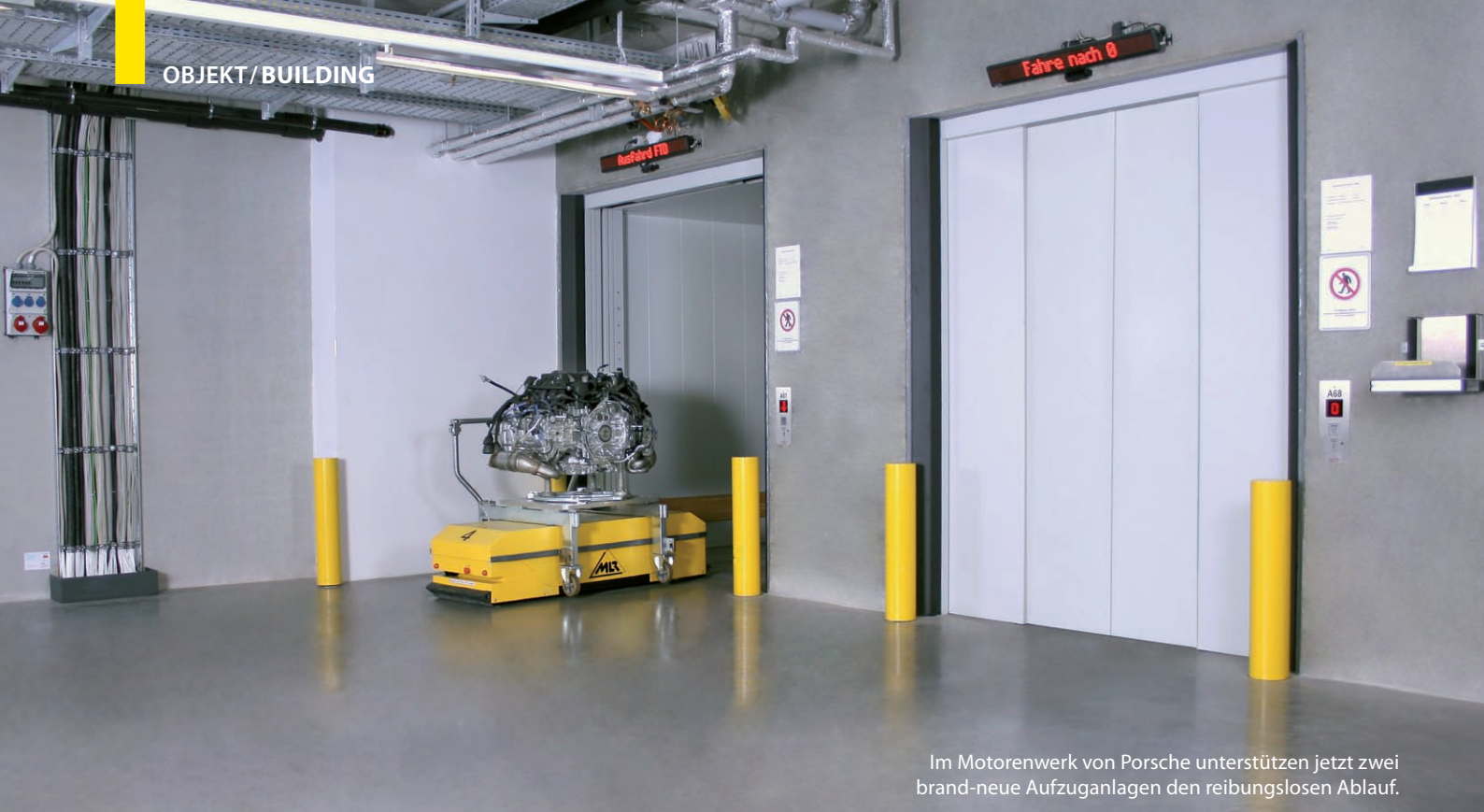
Im Motorenwerk von Porsche unterstützen jetzt zwei brand-neue Aufzugsanlagen den reibungslosen Ablauf.